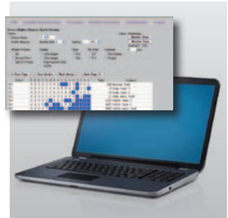
Überwachung über das Web-Interface