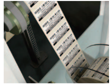
Etikettendruckmaschine mit Netzwerkanbindung