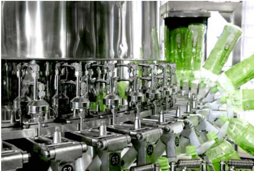
Ablaufsteuerung in der Nahrungsmittelindustrie