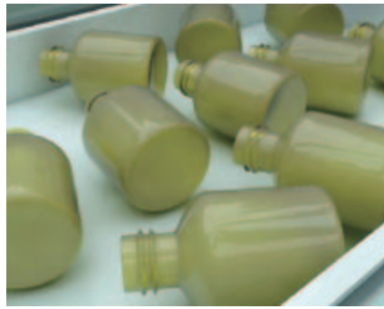
Analog-Datenverarbeitung für Spritzgussmaschinen