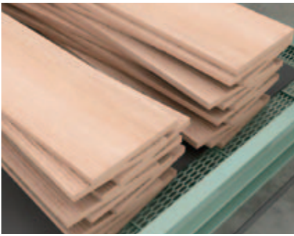
Fertigungskontrolle in der Holzbearbeitung